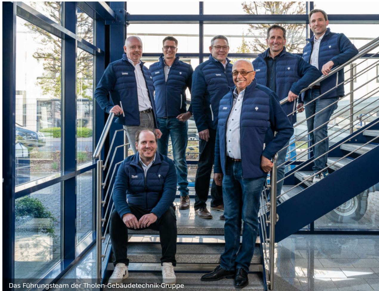
Das Führungsteam der Tholen-Gebäudetechnik-Gruppe